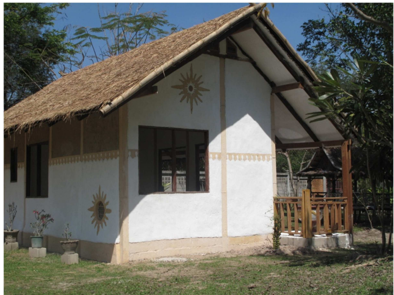
Foto a lato: Modulo abitativo realizzato in Laos da AIB: circa 35 mq di superficie, realizzato in bambù, legno, terra cruda e paglia e pula di riso e calce naturale. Realizzato in meno di un mese con giovani contadini locali. Sotto: Stardome in bambù splittato.

Le lezioni teoriche sono effettuate nell'ampio locale della struttura ospitante mentre le applicazioni pratiche si svolgono nei cantieri e nella piantagione annessi alla Fattoria e presso il vicino vivaio di bambù Moso.